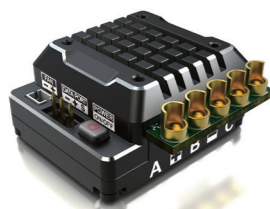
TS120A ESC ブラックアルミエディション 価格: ¥17,800(税抜) 品番: G0067