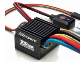
TS50A ESC Type-C 価格: ¥4,900(税抜) 品番: G0089