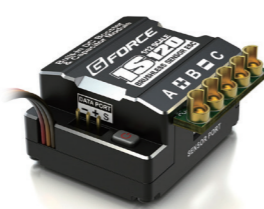
1S120A ESC 価格: ¥16,000(税抜) 品番: G0014