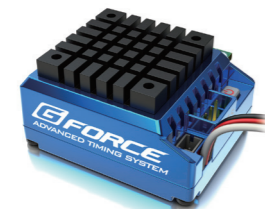
TS120A ESC 価格: ¥14,500(税抜) 品番: G0011