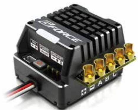
[G FORCE TS160 COMPETITION]