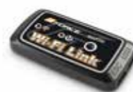
Wi-Fi Link(品番:G0034) (iPhone・Android両対応)